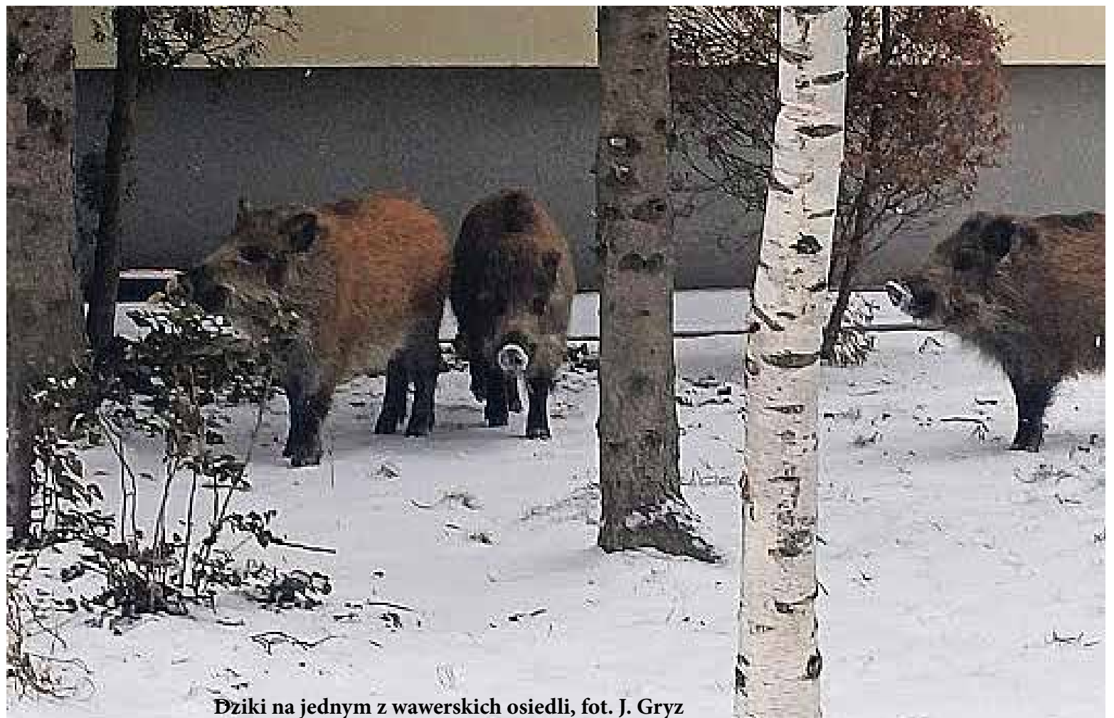
Dziki na jednym z wawerskich osiedli