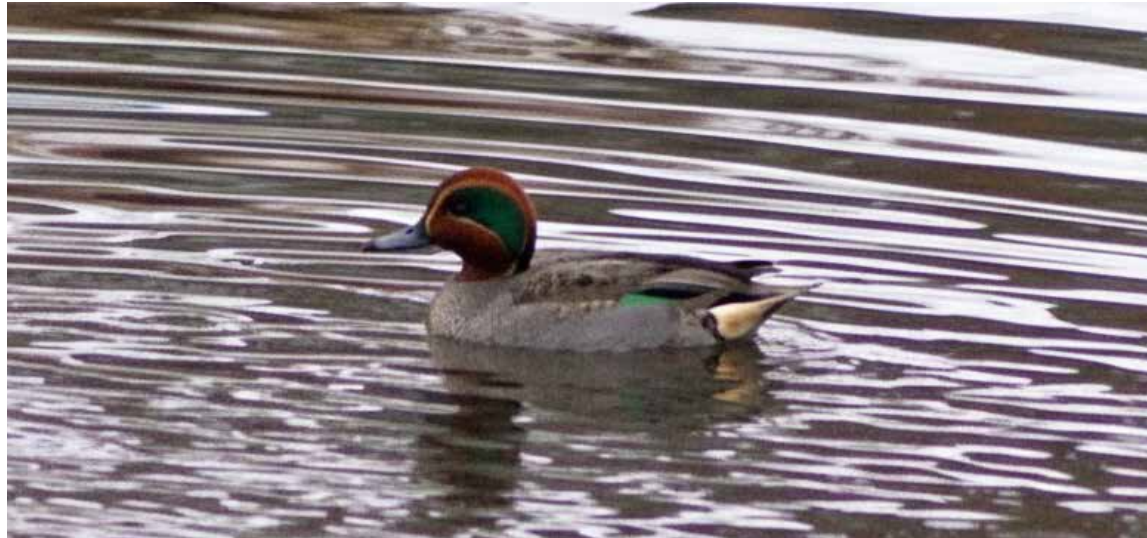
Kaczka cyraneczka - samczyk.