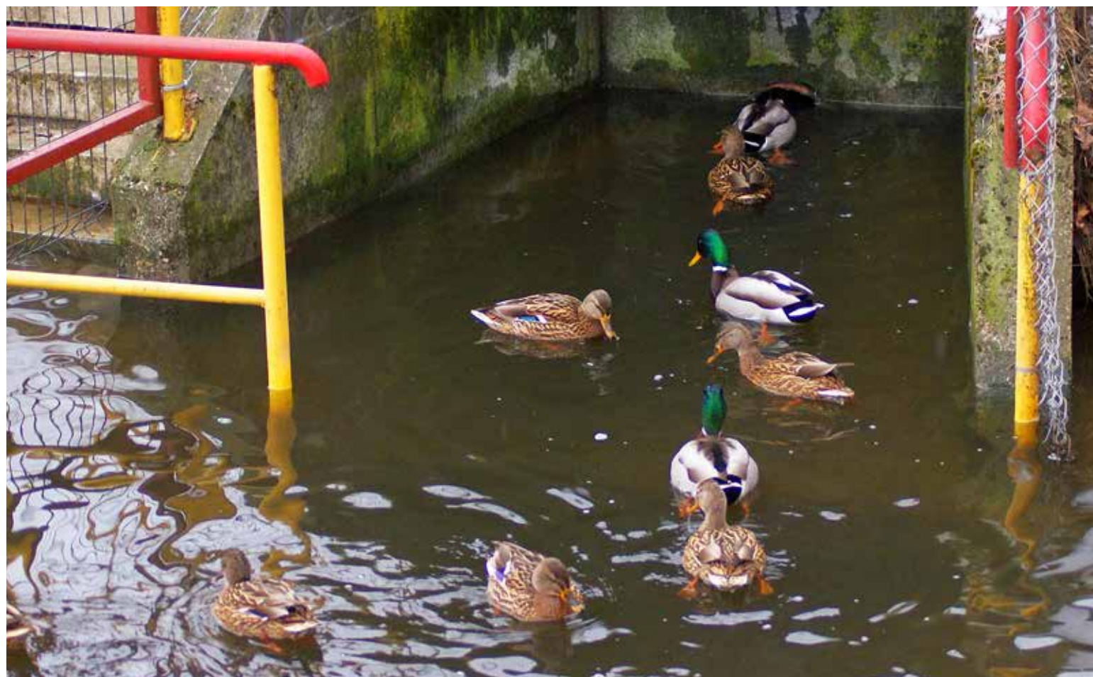
Oczyszczalnia „Cyraneczka” - kaczki jedzą zawieszony ze ścieków, luty 2026 r.