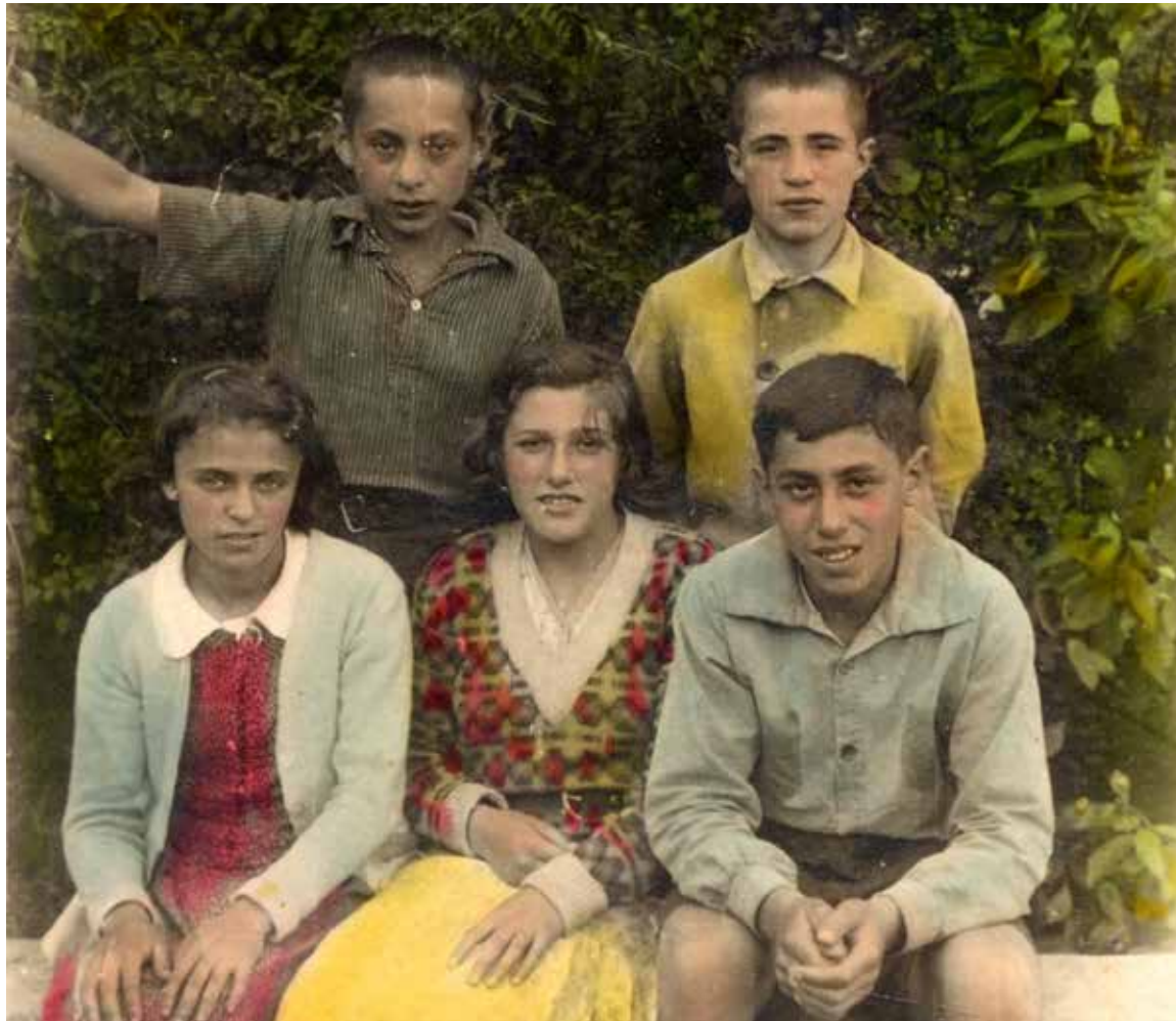
Uczestnicy kolonii letnich w Goławku, koloryzowane ręcznie jeszcze przed 1939 r.; fot. z archiwum cyfrowego R. Wróblewskiego.