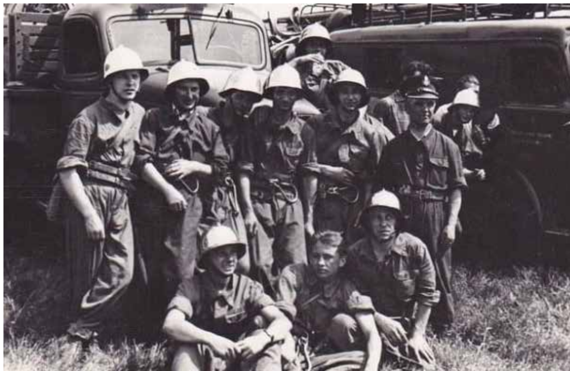
Strażacy OSP przy samochodzie Chevrolet G-506 w 1947 roku