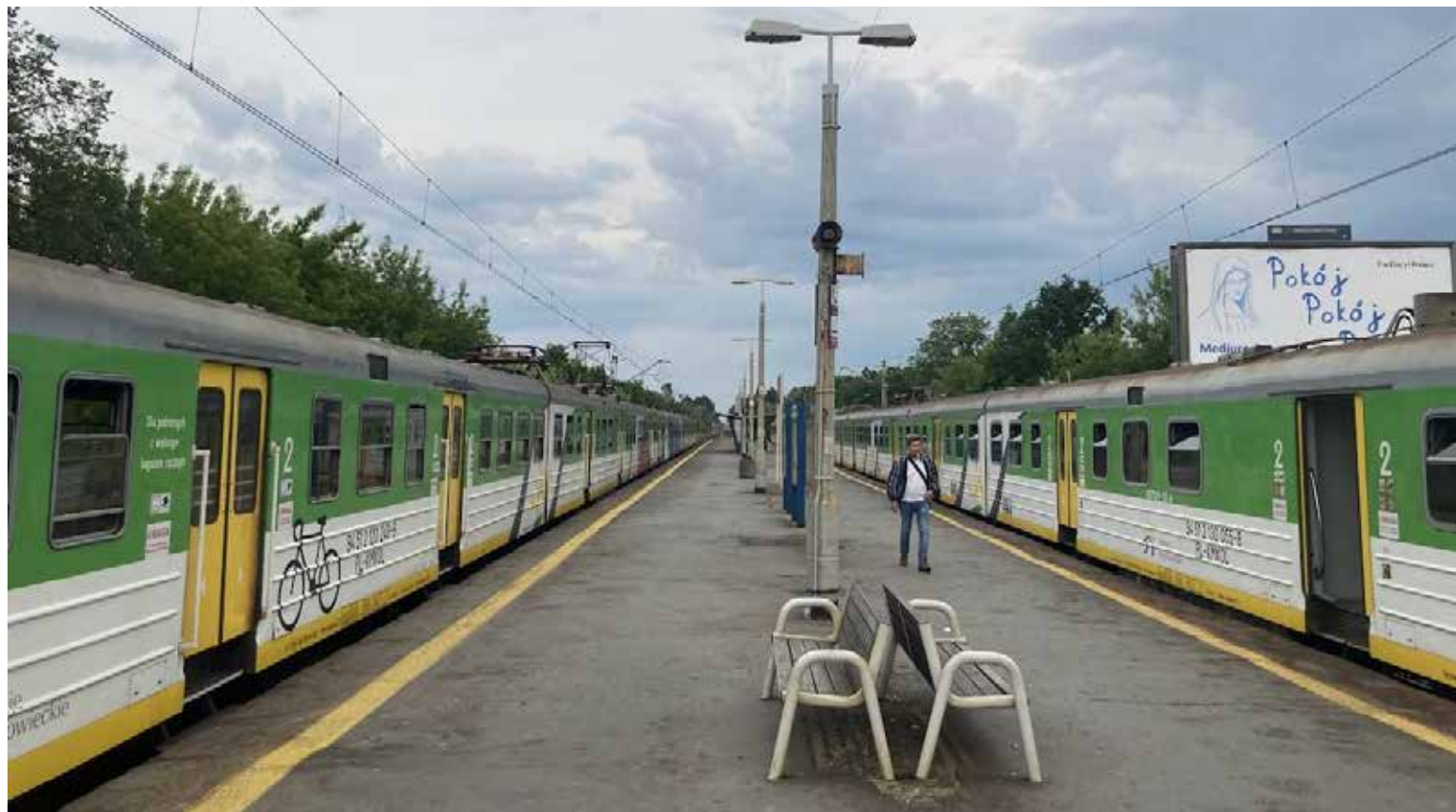
Przystanek osobowy Warszawa - Anin.

Dyskusja (np. o komunikacji zastępczej) jest jak najbardziej potrzebna, a presja społeczna ma sens. Udowadniają to choćby analizy uruchomienia dodatkowego połączenia z Falenicy na Ursynów, na którym bardzo zależy mieszkańcom. Jednak lokalne dywagacje (zwłaszcza post factum) nt. zakresu inwestycji są przysłowiową parą w gwizdek. Jeśli rząd postanawia o budowie 2 a nie 1 dodatkowego toru, to co właściwie możemy zrobić? Ponarzekać albo założyć, że władza wiedziała, co robi. Może faktycznie rozwój transportu kolejowego wymaga takiej, a nie innej skali inwestycji. W praktyce nie mamy wiedzy ani narzędzi, by to zweryfi-